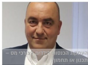
העסקות הכנסות לילדים יצרכי מס – תכנון או תחמוץ