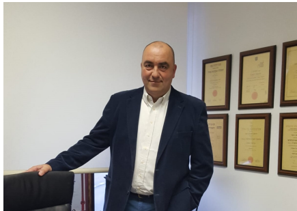
אילוסטרציה: carlos aranda, Unsplash