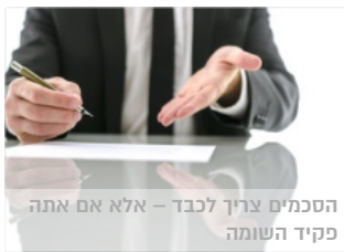
הסכמים צריך לכבד – אלא אם אתה פקיד השומה